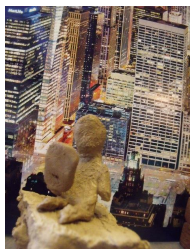
Zjeff (10 ans) « Je lis à New-York. » Composition