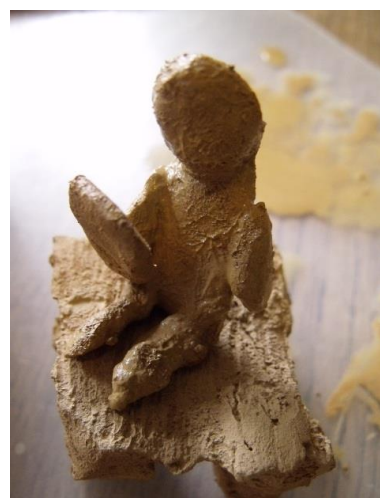
« Je lis seul dans ma chambre. » Autoportrait en terre cuite H : 10 cm

Tout en « créant », la personne fait appel à ses « ressources » pour aller vers son objectif. Elle se (re)découvre des capacités, de l'estime de soi, de l'amour de soi, de la confiance en soi, du respect de soi, ... La création permet de s'extérioriser, d'entrer en contact avec les autres. Elle est la métaphore, l'intermédiaire, la possibilité de communiquer ... Ce n'est pas l'Art pour l'Art mais l'expression de « l'essence ».