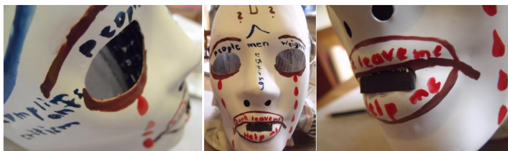
Mlle S (27 ans) « Sans mots » Masque - Acryl

Les choses de l'esprit qui ne sont pas passées par les sens sont vaines.